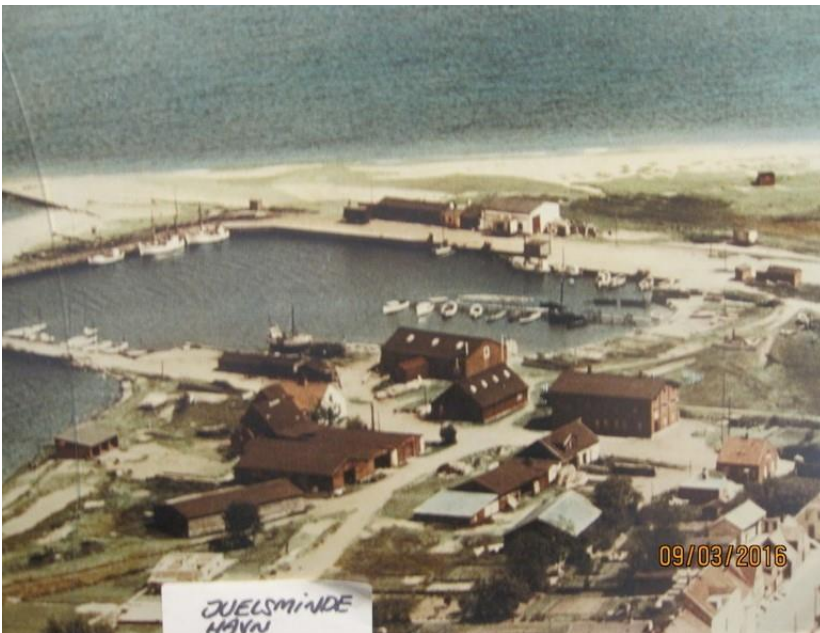
B10162 Luffoto fra 1947