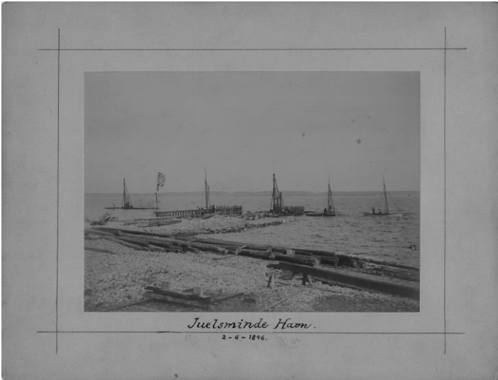
B10001 1896 Havnen anlægges